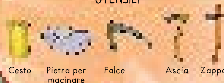
Cesto Pietra per macinare Falce Ascia Zappa