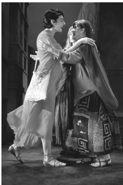
Fig. 4. B. Viola, The Greeting , 1995

Il presente campionamento copre invece l'opera di Kentridge, che si cimenta in un lucido smontaggio e rimontaggio delle strutture dell'espressione dipinta, più precisamente del disegno. Si vedrà come egli frughi nei meccanismi interni di un'"arte dello spazio" per animarla e farla scorrere anche sui binari del tempo.