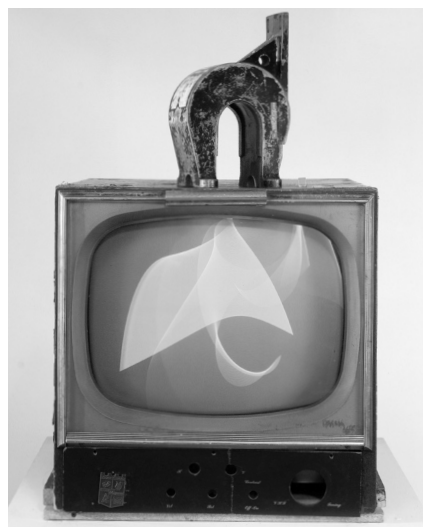
Fig. 3. N. J. Paik, Magnet Tv , 1965