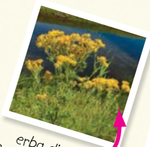
erba di San Giacomo

Piante velenose I cavalli non dovrebbero avere accesso a queste piante.