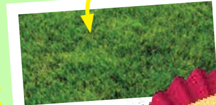
Un bel paddock

Attenzione! Tenere il paddock pulito dagli escrementi aiuterà a evitare che il cavallo prenda i vermi.