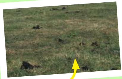
Un brutto paddock

I cavalli non pascolano in modo uniforme. Mangiano parti del prato fino al terreno e lasciano ciuffi di erba alta in altre zone. Per uniformare il pascolo, lasciate il paddock vuoto di tanto in tanto, e fatevi pascolare pecore o mucche. Due o tre volte l'anno, il paddock dovrà essere 'cimato' – tagliando la sommità di tutte le erbe.