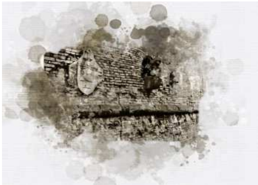
Tori3n de 'a Gata e Col3na Massimiliana (1 e 2)