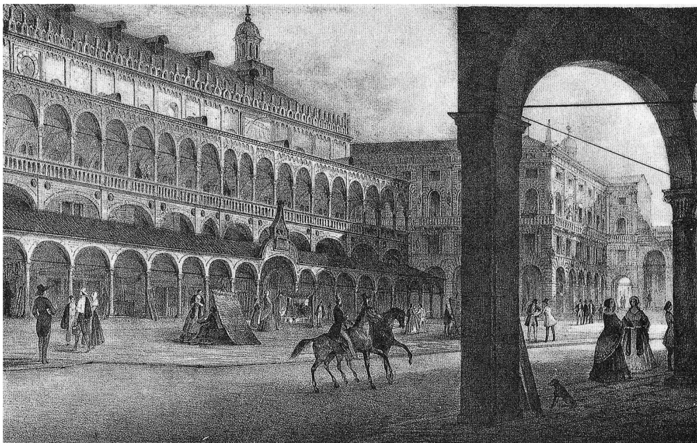
Piassa de te Erbe, Salón e Palasso Comunàe (dis. de M. Moro del 1842)