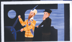
Molti reali viaggiarono in treno. Il re di Bulgaria mostrò il per guidarlo, cosa che fece a una velocità da far rizzare i capelli.